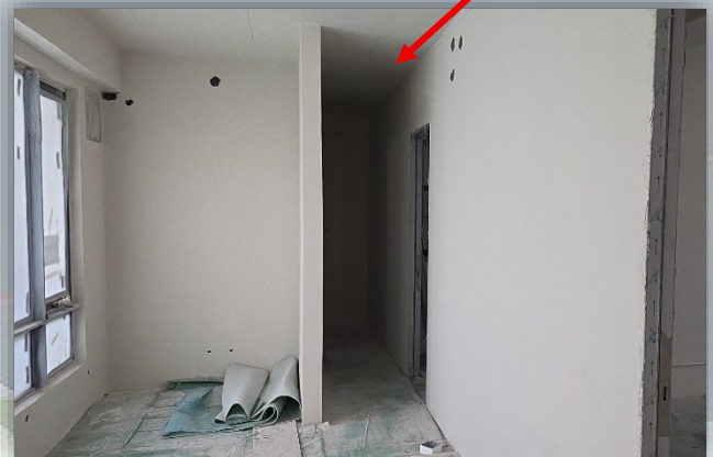
A&A works for Administration Building 行政大樓改建和加建工程