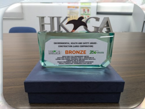
Environmental, Health and Safety Award – Construction - Bronze