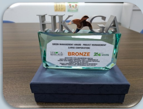
Green Management Award – Project Management - Bronze

Our project participated in the Hong Kong Green Awards 2025, receiving three accolades that affirm its efforts in sustainability and environmental protection. 本工程參加了 2025 年香港綠色企業大獎，獲得三個獎項，充分肯定了在可持續發展與環境保護方面的努力。