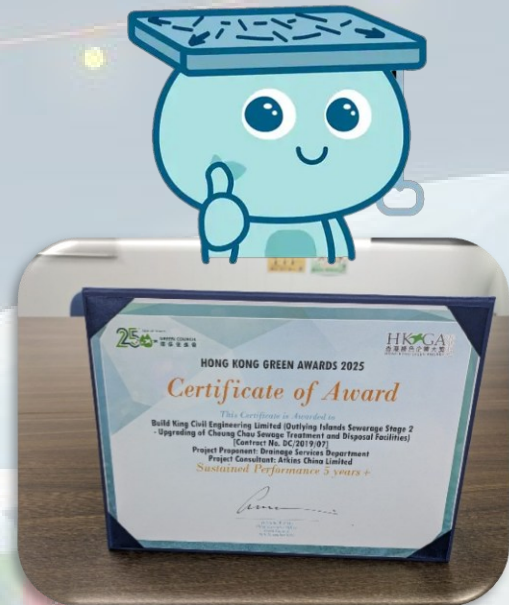
Certificate of Sustained Performance 5 years+ 持續表現超過 5 年證書