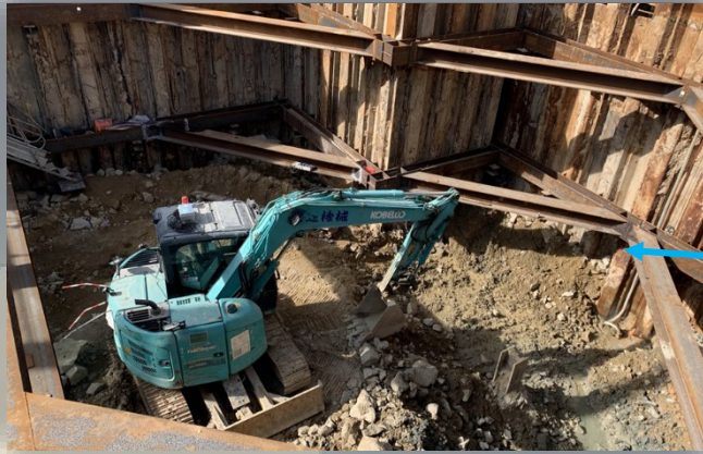
Excavation and lateral support works for Sludge Centrifuge House 污泥離心機大樓的挖掘與側向承托工程