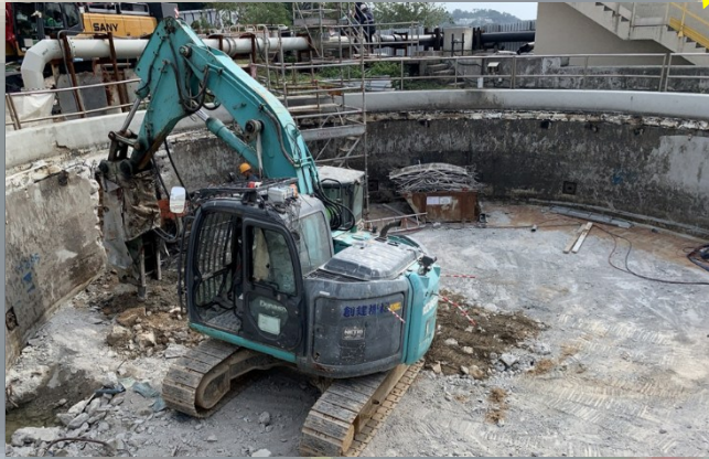
Demolition of the existing Primary Sedimentation Tank 現有初級沉澱池拆卸工程